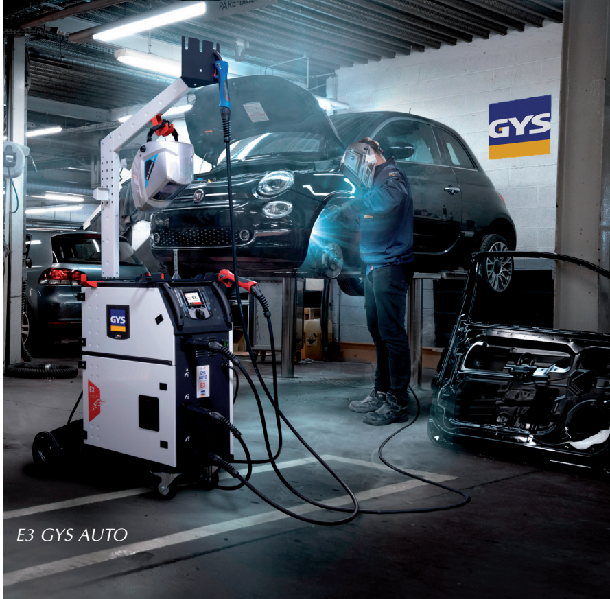
E3 GYS AUTO

GYSPRESS hace el remachado más seguro, rápido y sin error