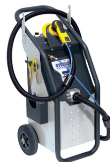
GYSDUST Extractor cumple la norma ATEX

Imprescindible para el ensamblaje por remacho/encolado, GYSPRESS es una remachadora hidroneumática conectada que proporciona trazabilidad, rapidez y facilidad de uso. Finalmente, el aspirador neumático para el polvo GYSDUST Extractor es el aliado ideal para mantener el taller limpio. Además, se puede utilizar con todo tipo de lijadoras neumáticas comerciales.